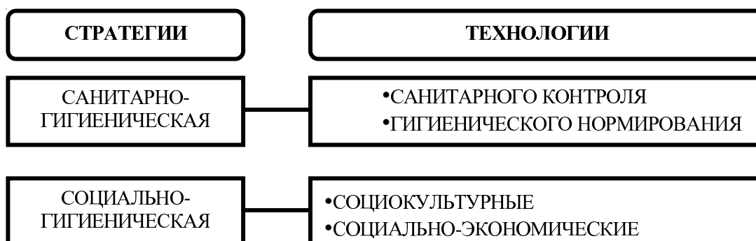
Рис. 2. Концептуальная схема направлений и стратегий профилактической медицины